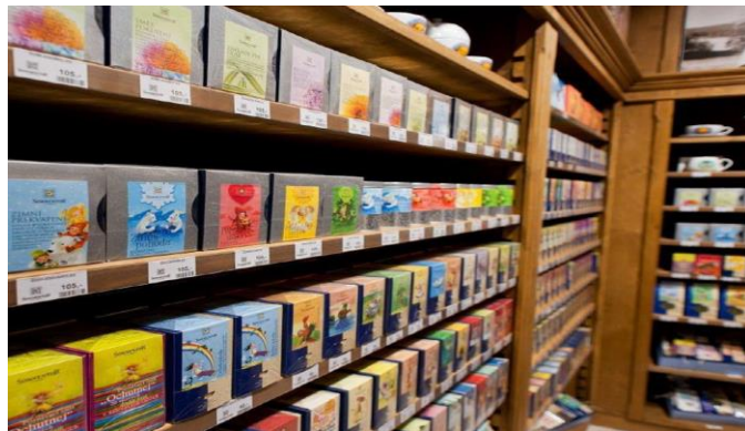
Čejkovice - ubytování hotel Albor