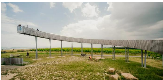
Prohlídka templářských sklepů s degustací